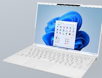
<白モデル：シルバーホワイト>