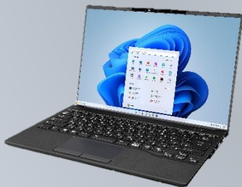
<黒モデル：ピクトブラック>