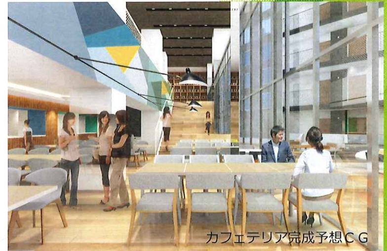
カフェテリア完成予想CG