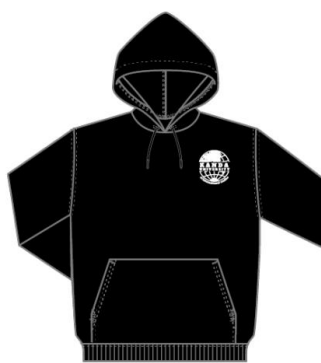
■ブラック×ホワイト 5,500円（税込み）