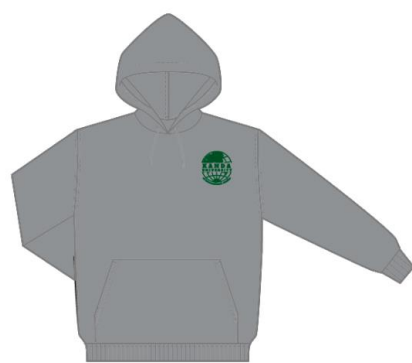
■空グレー×グリーン 5,500円（税込み）