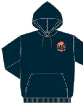
■ネイビー×オレンジ 5,500円（税込み）