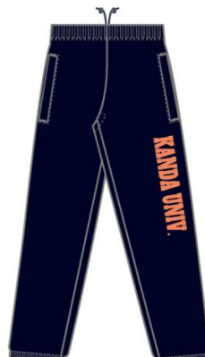
■ネイビー×オレンジ 4,200円（税込み）