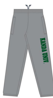
■空グレー×グリーン 4,200円（税込み）