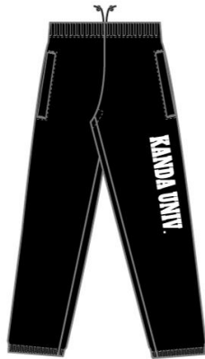
■ブラック×ホワイト 4,200円（税込み）