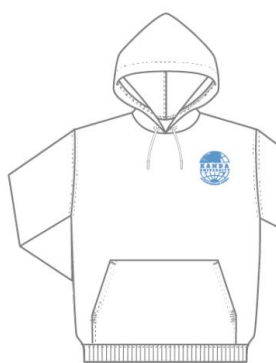
■ホワイト×サックス 5,500円（税込み）